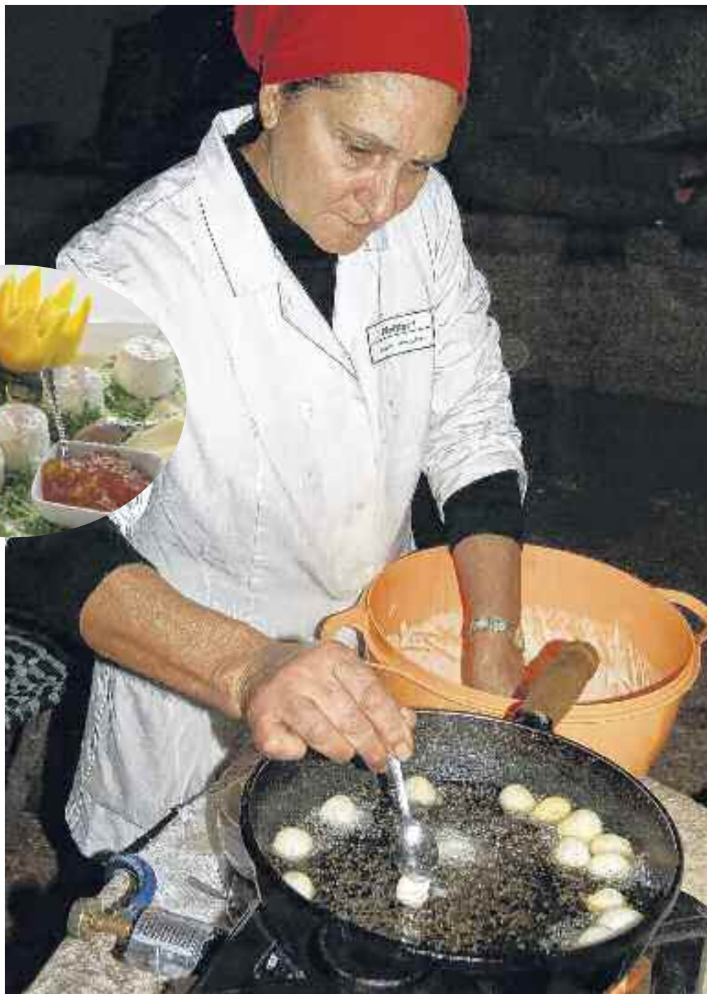
Buon Appetito in Apulien: In der Masseria Ottava Piccola werden köstliche Pettole in Olivenöl frittiert (o.). Frische Ricotta darf auf keiner apulischen Tafel fehlen (o. l.). Lecce, einst Stadt des Tabaks, bleibt ein Juwel des Barock (o.r.). Die schweren Ölmühlsteine wurden früher von Mulis gedreht (r.).

wieseln mit Flaschen und Plat- ten. Sechs Gänge werden auf- getragen, Slow Food gibt das Tempo vor: langsam mit Ge- nuss! Der Bauchspeck kommt vom schwarzen daunischen Schwein, das stundenlang in Tomaten geköchelte Fleisch von der mageren podolischen Kuh. Käse, Gemüse, Marmela- den – alles biodynamisch zer- tifiziert. Man schwelgt.