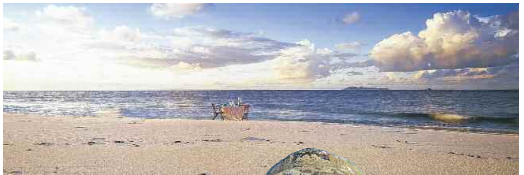
Eine Insel bietet eine sehr private und besondere Atmosphäre – und die können sich Urlauber jetzt auch für die nächsten Ferien buchen.